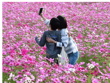
【コスモス畑の様子】