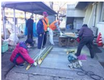
【 慣れた手つきで作業中 】

毎年12月中旬に「門松づくり」を行っています。地元老人クラブ、民生委員、自治会、地域の有志の方々と松や竹、梅や南天などを山から切り出して材料を準備し、設置場所の公民館、小学校、こども園で作業を行い、高さ180cmの立派な門松ができました。