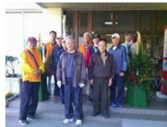
【 参加者のみなさんと 】

最近ではこんなに大きな門松を見ることも少なくなりましたが、番城公民館の門松は新年を迎えるにふさわしい立派なものとなっています。