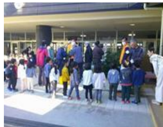
【 興味津々の園児たち 】