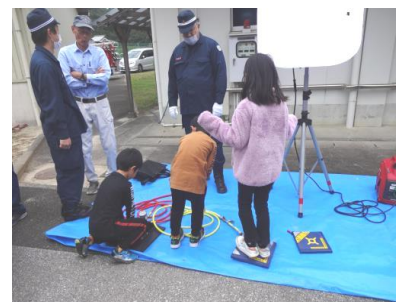
【 救助用機械説明 】