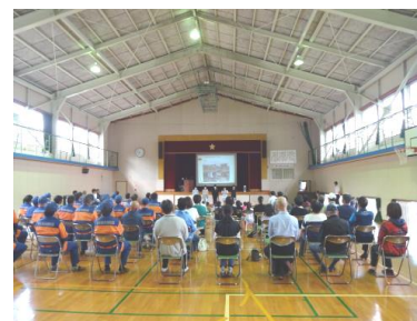
【 児童による発表 】