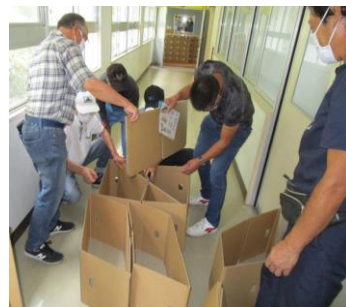
【段ボールベットの組立て】