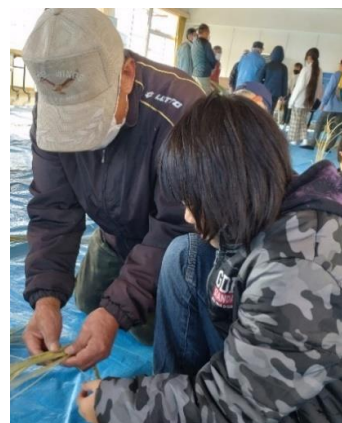
【ここが難しいけん！】

餅つきでは、寄贈された昔の足踏み式餅つき機（やぐら）を使ったことがない子どもがほとんどで最初はぎこちない動きでしたが、お父さんたちや老人会の指導で次第に上手に安全につくことができました。