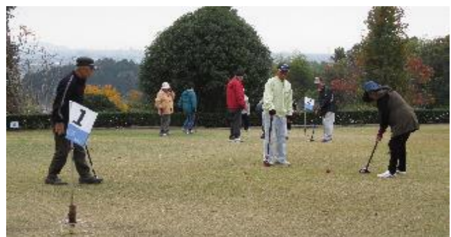
【グラウンドゴルフ大会の様子】