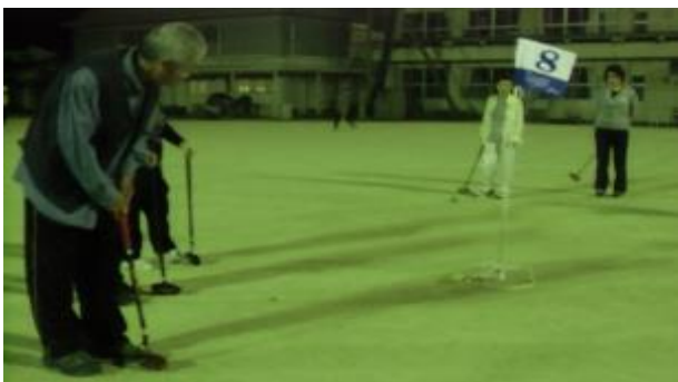
【スポーツ教室開催の様子】

日程は9月から10月にかけての5回(19時~21時)を予定しており、毎回の出席率はほぼ100%に近い状態となっております。