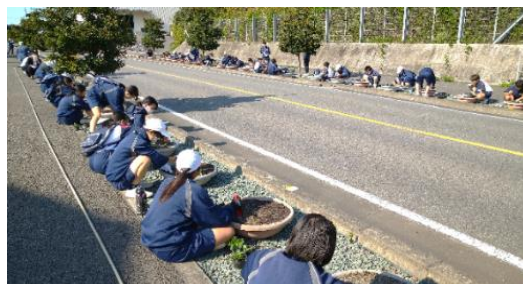
【中学生による花の仮植】