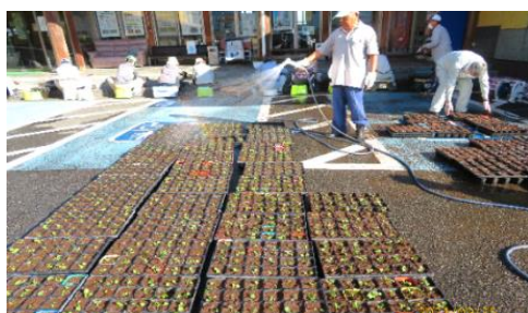
【3日かけて仮植を行います】

平成15年より毎月第2日曜日に「大好き泉川の日」の活動が行われています。自主参加のボランティア活動で、小学生と先生・保護者、地域の方は公民館に集まり1時間以内に11号バイパスのゴミ拾いを行います。中学生は、生徒が話し合いで決めた校区内の美化活動を行っています。毎回多くの生徒が参加し、100名近く集まることもあります。「美しいまちは安全なまち」の標語が校区内に掲示されています。