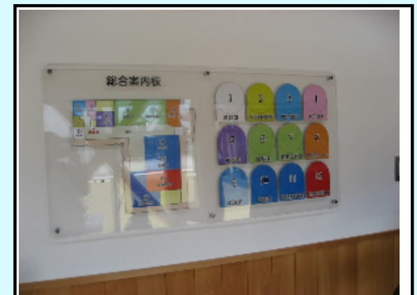
色分けされた案内プレート