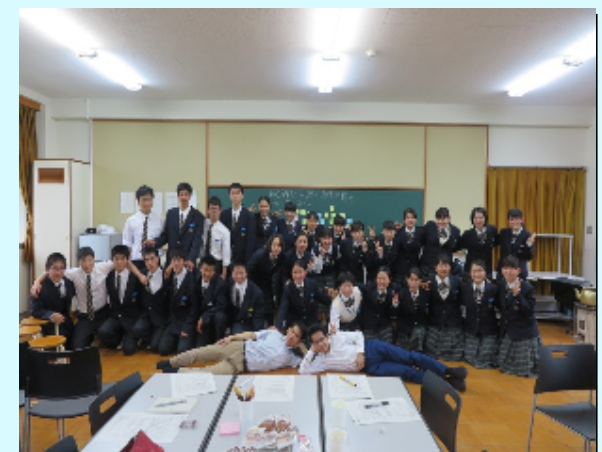
県立三崎高等学校の生徒とともに