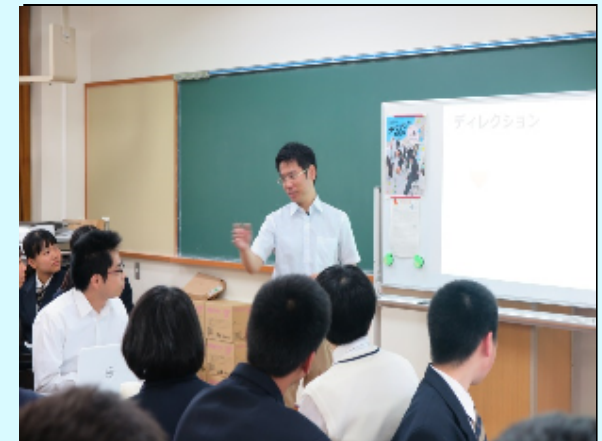
公営塾『未咲輝（みさき）塾』での授業の様子