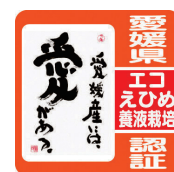
県認証農産物(養液栽培)