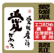
農薬・化学肥料不使用農産物

また、「エコえひめ農産物」の基準に加え、GAPの取組みを行っているものを「 えひめGAP農産物 」として認証しており、別途マークが定められています。(詳しくは、最寄りの地方局農業振興課にお問い合わせ下さい。→P26)