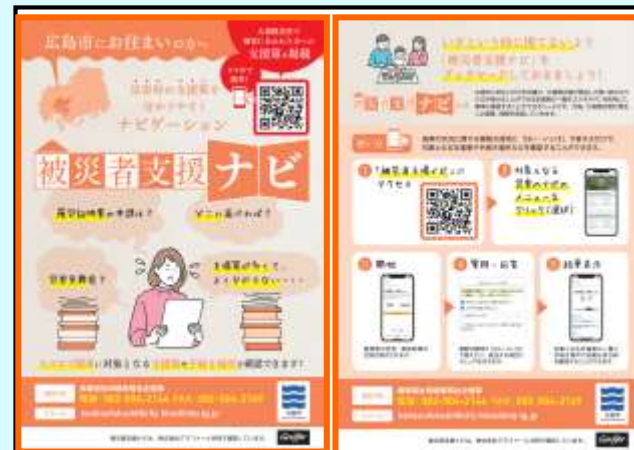
区役所や公民館等に設置したチラシ

デジタル化というとハードルが高い印象を持ちますが、導入までの過程一つ一つはそれほど難しいものではありませんでした。世の中にどのようなICT技術があり、どのような課題を解決しているのかということにアンテナを張っておくことが大切だと感じました。