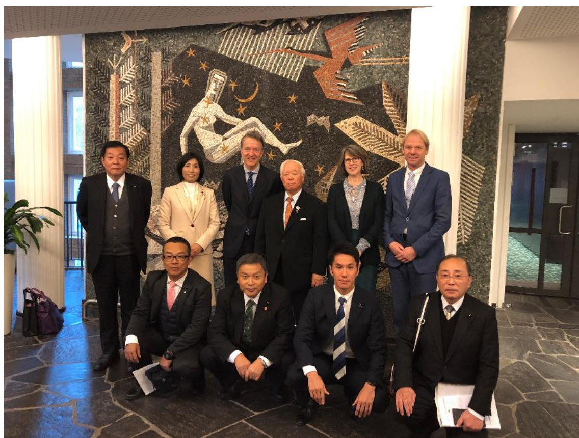
【オランダ・ハーグ】 オランダ農業・自然・食品品質省 訪問