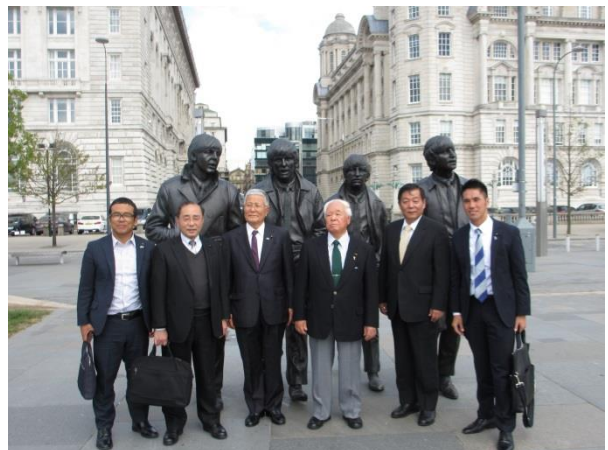
ピア・ヘッドに建立された「ビートルズ」のブロンズ像

観光政策は、費用対効果が見えにくいものであり、一歩間違えれば観光事業向けの大型投資が、行財政を圧迫するという話をよく聞くが、リバプールにおいては、世界遺産やビートルズ、またはプロサッカーなど様々なツールを使うことで着実に観光客数を伸ばし、民間投資を喚起していた。