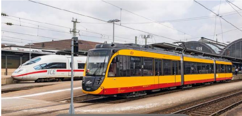
高速鉄道に乗り入れるトラムトレイン