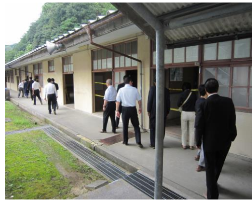
吉田中学校 (宇和島市)