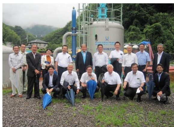
吉田浄水場代替浄水場施設 (宇和島市)