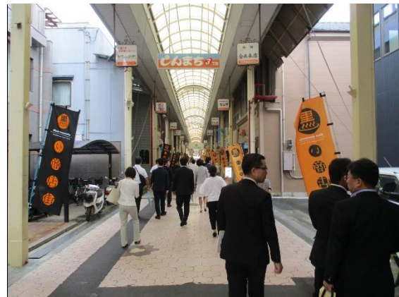
八幡浜新町商店街振興組合 （八幡浜市）