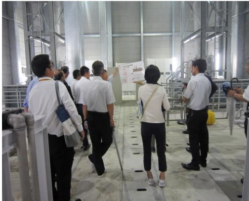
鹿野川ダム (大洲市)