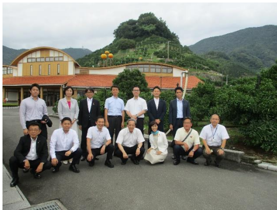
果樹研究センターみかん研究所 （宇和島市）