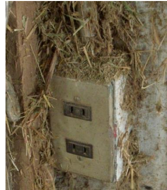
写真2 コンセント等の周囲はホコリが溜まらないように掃除する