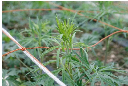
写真1 一番花抽台後の出蕾 (さくらひめ)