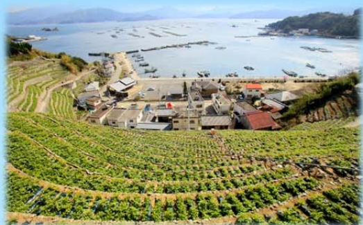
H28 優秀賞 『遊子水荷浦の段畑』

「長浜大橋」「遊子水荷浦の段畑」「泉谷の棚田」など、歴史的・文化的に価値のある南予の遺産の写真にエピソードを添えてご応募ください。