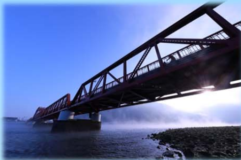
H28 最優秀賞 『長浜大橋』