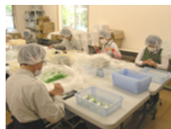
⑨衛生用品検査組み立て