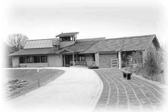
えひめエコ・ハウス全景