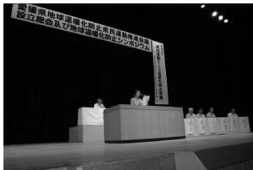
〔愛媛県地球温暖化防止県民運動推進会議設立総会〕

県では、同会議を核として、企業や団体、自治体など、各主体間での情報交換や連携を密にし、より効果的な温暖化対策を推進しており、家庭・オフィス・工場・運輸などの各部門においても、適正な冷暖房温度の設定、クールビズ、エコドライブなど、温暖化防止に向けた身近なところからの取組が進められている。