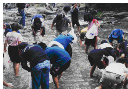
愛リバー・サポーター清掃美化活動