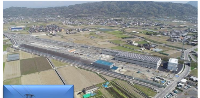
新松山貨物駅全景