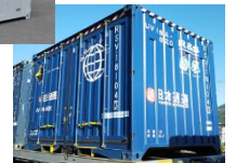
Rail & Seaコンテナ