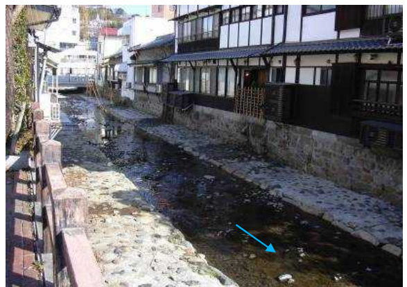
市街地を流れる辰野川(下流)