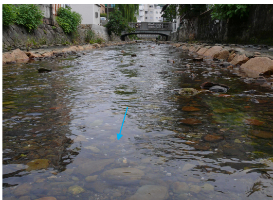
辰野川の澄んだ流水