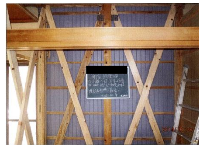
押入れ内の壁を筋交いと構造用合板で補強