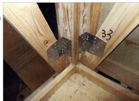
筋かい金物による補強