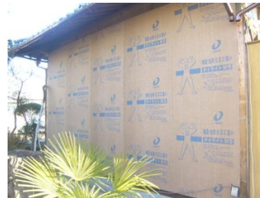
外壁を構造用合板で補強