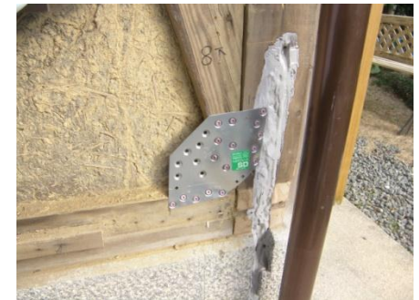
筋かい金物による補強 ARS工法による補強