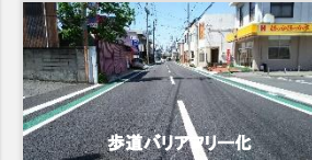
歩道バリアフリー化