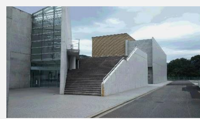
四国中央市歴史考古博物館