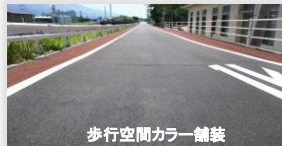
歩行空間カラー舗装