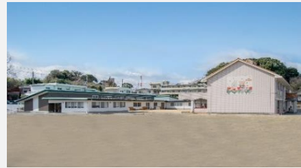
川之江認定こども園