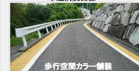
歩行空間カラー舗装