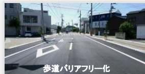
歩道バリアフリー化