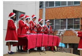
クリスマスコンサート

拠点施設は、休憩やトイレなど誰でも自由に利用できるほか、公益的な賑わいイベントであれば無償で場所を貸出。運営団体だけでなく、個人・団体・企業によるイベントが随時開催されている。