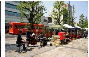
路上ジャズライブ