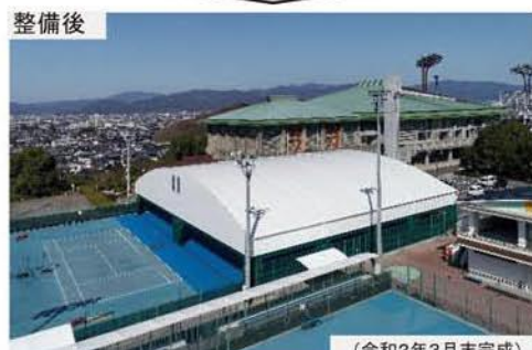
※機能向上及び利用者の利便性向上のため、2面に屋根を整備