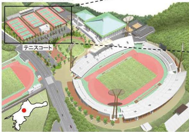
愛媛県営総合運動公園 昭和55年5月開園。ニンジニアスタジアム(陸上競技場)、補助競技場、テニスコートなど、屋内・屋外の様々なスポーツに対応できる複合施設を有しています。2017年(平成29年)開催のえひめ国体・障がい者スポーツ大会の中核施設としても活用されました。