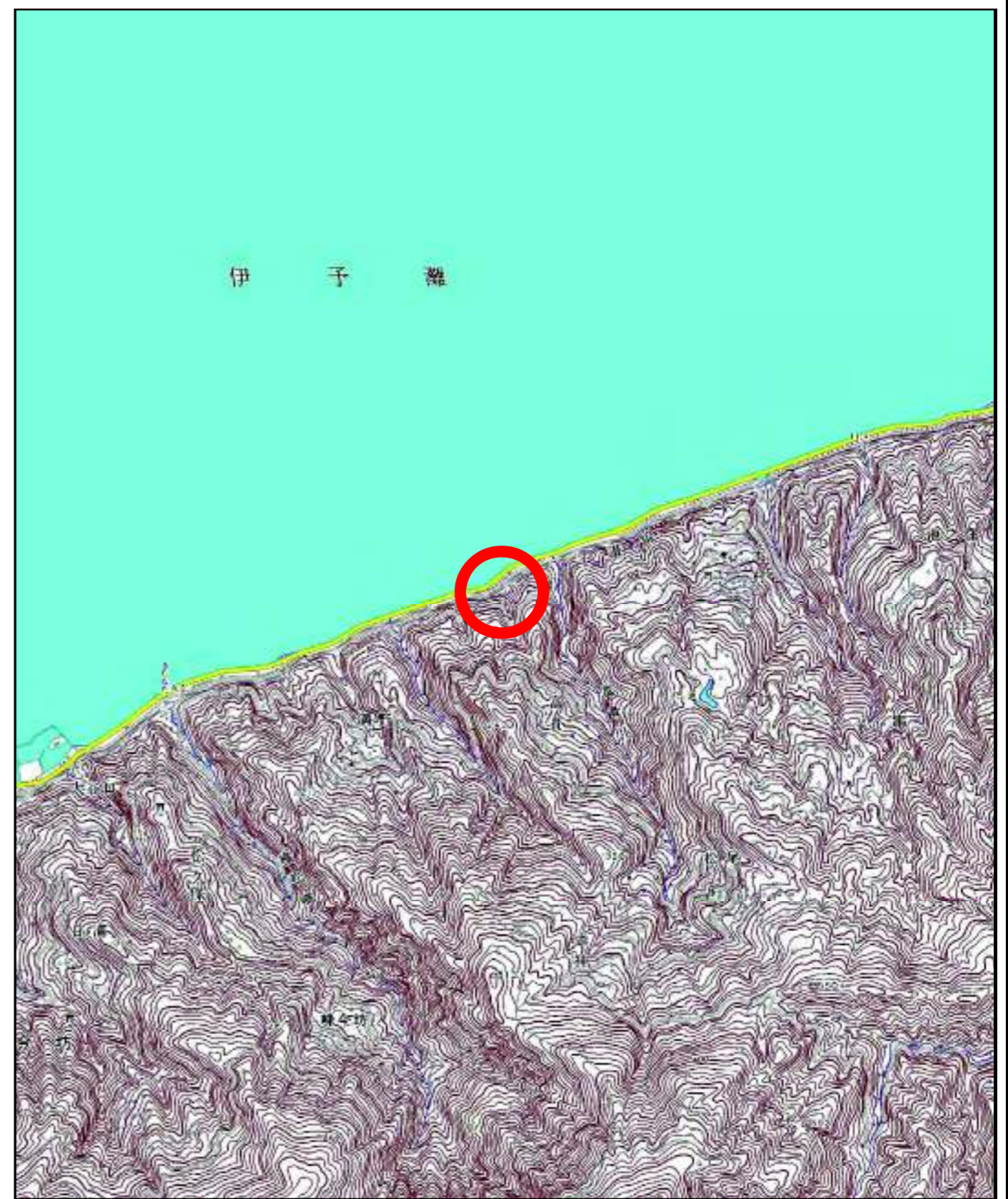
様式-1 (土) 土砂災害警戒区域・土砂災害特別警戒区域 位置図