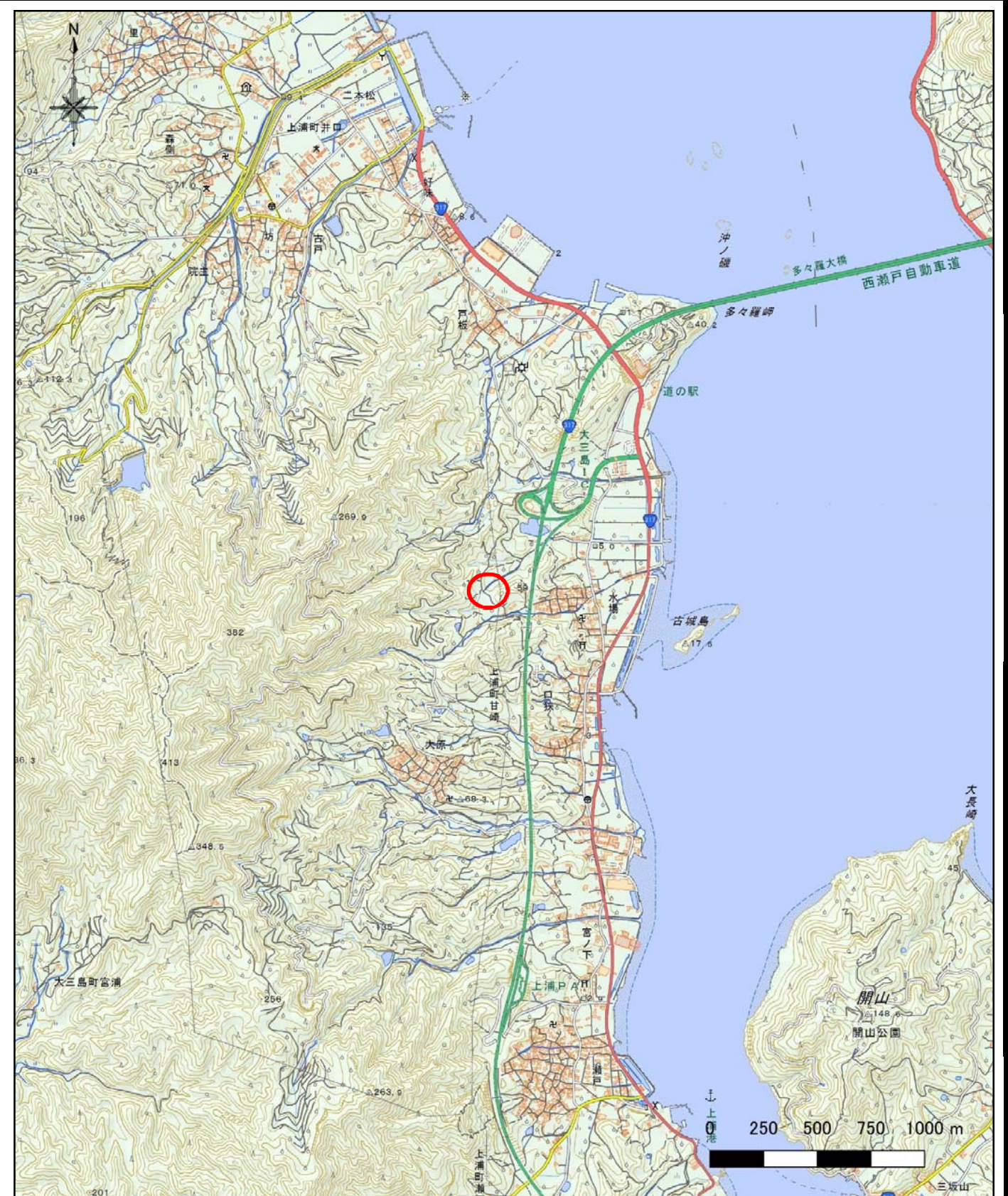
様式-1 (土) 土砂災害警戒区域・土砂災害特別警戒区域 位置図