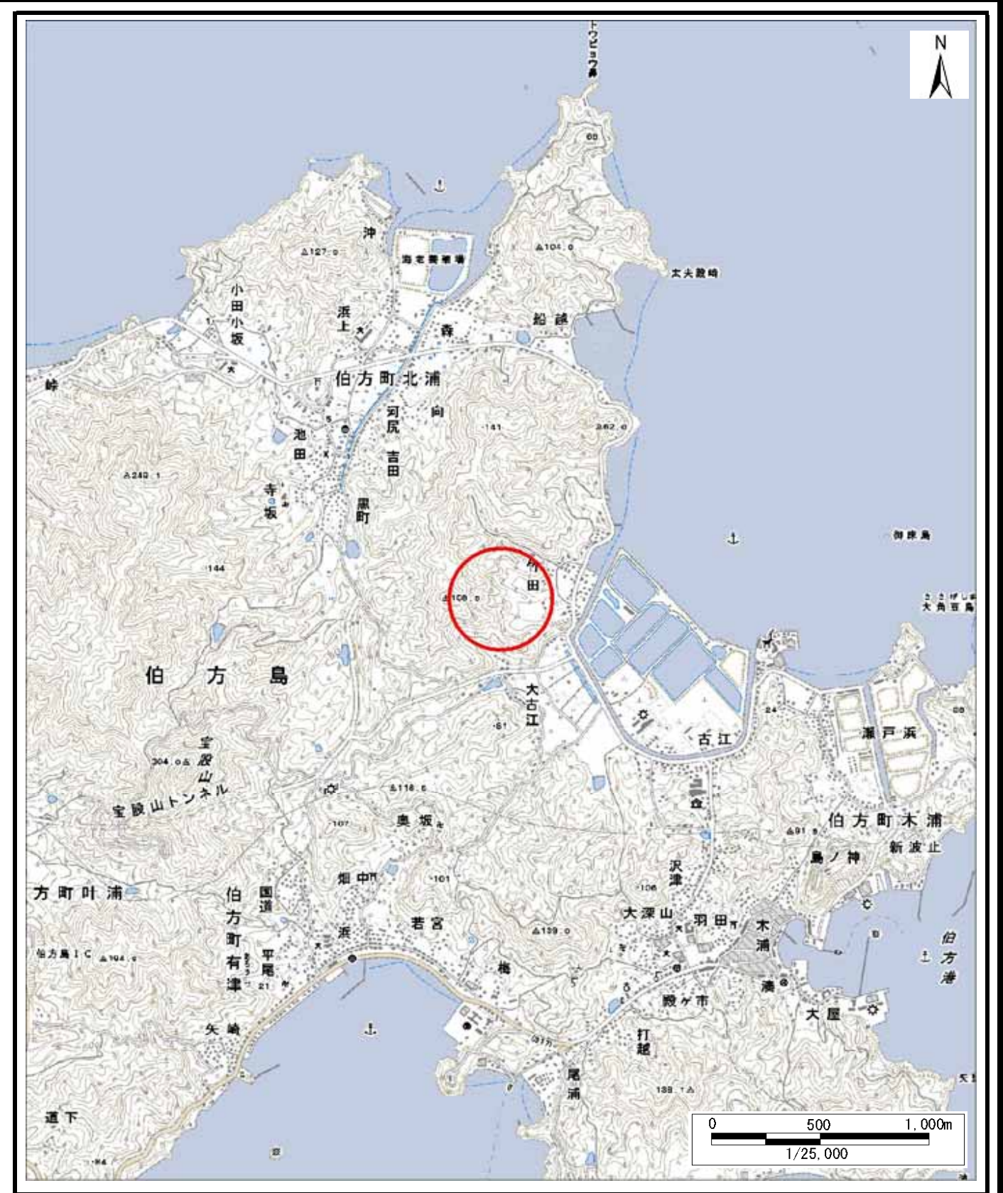
様式 - 1 (土) 土砂災害警戒区域・土砂災害特別警戒区域 位置図