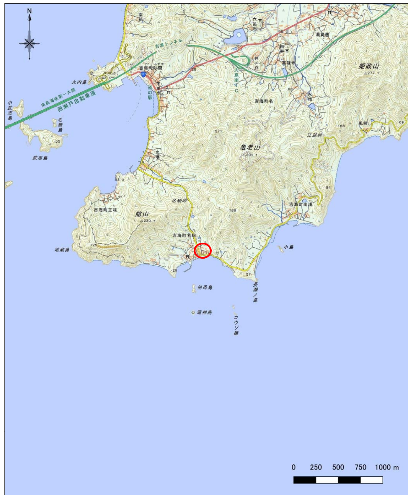
様式-1 (土) 土砂災害警戒区域・土砂災害特別警戒区域 位置図