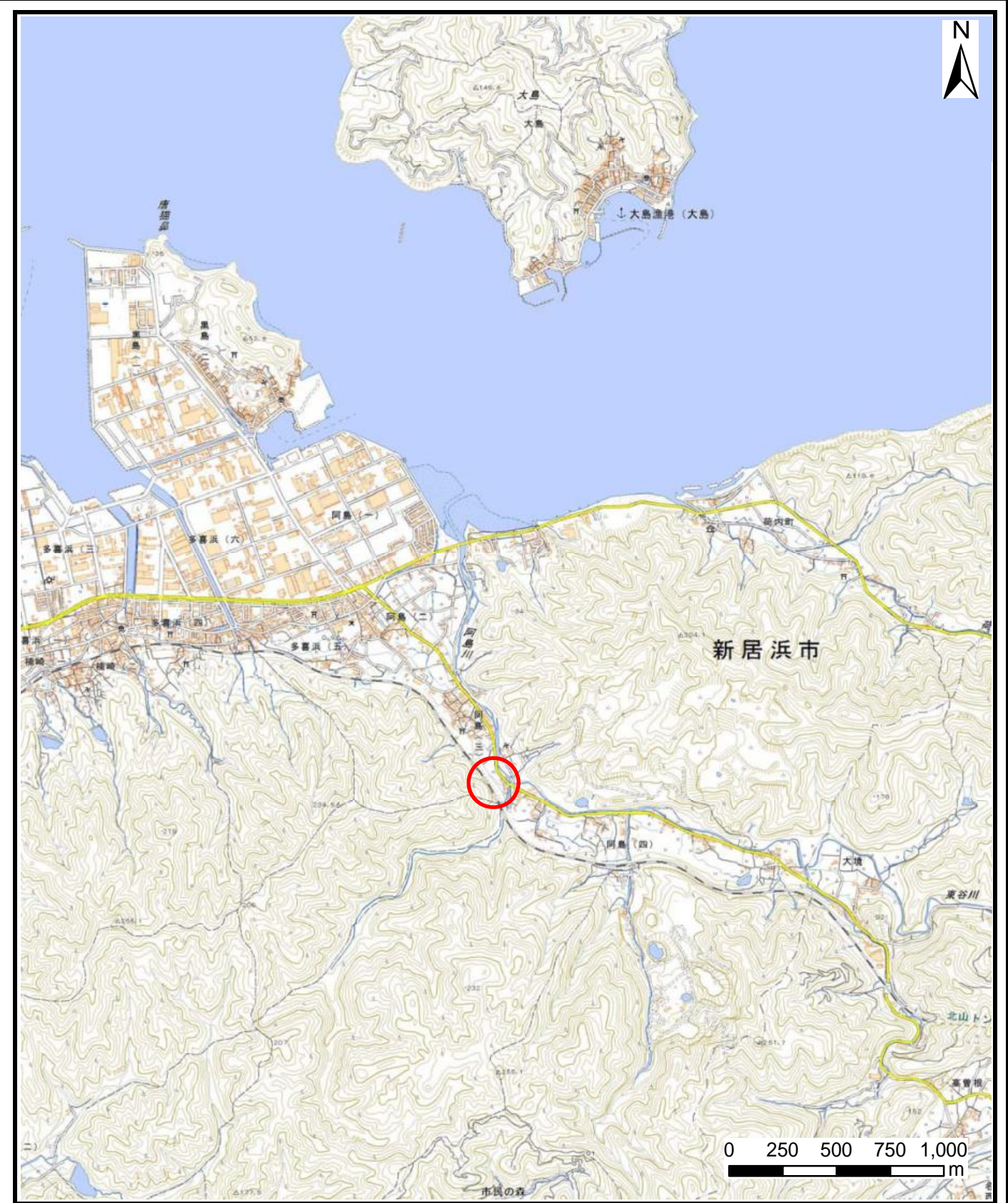
様式-1 (急) 土砂災害警戒区域・土砂災害特別警戒区域 位置図