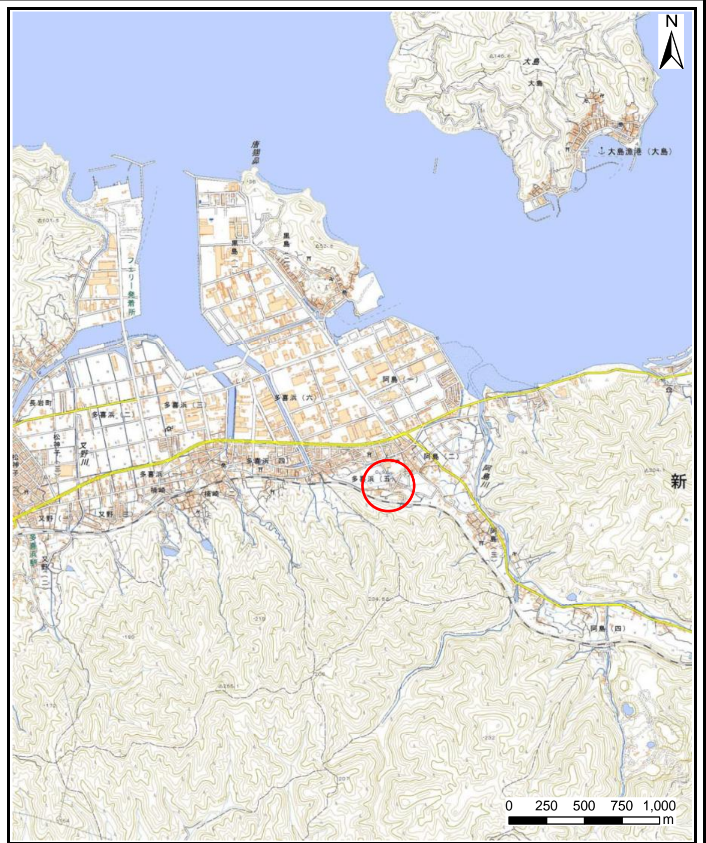
様式-1 (急) 土砂災害警戒区域・土砂災害特別警戒区域 位置図