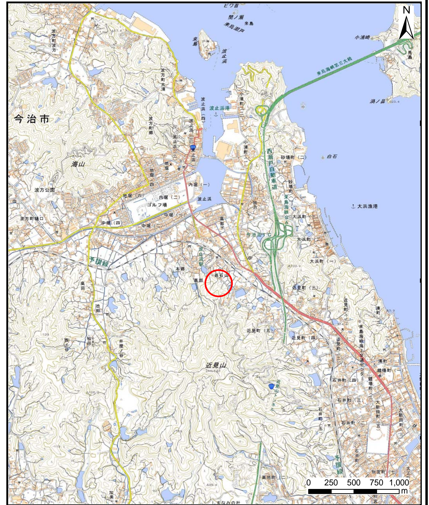
様式-1 (急) 土砂災害警戒区域・土砂災害特別警戒区域 位置図