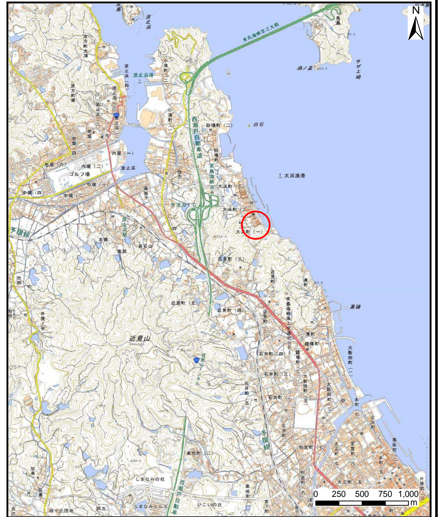
様式-1 (急) 土砂災害警戒区域・土砂災害特別警戒区域 位置図