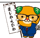
まじめきゃん (まじめ課長)

問い合わせ先 愛媛県土木部 河川港湾局 砂防課 担当 矢野(内線4395)、山本(内線4396) 〒790-8570 松山市一番町四丁目4番地2 TEL:089-912-2700 FAX:089-941-5887