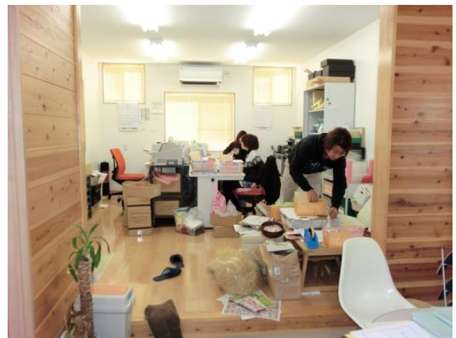
出荷繁忙期はスタッフと事務所内で執務