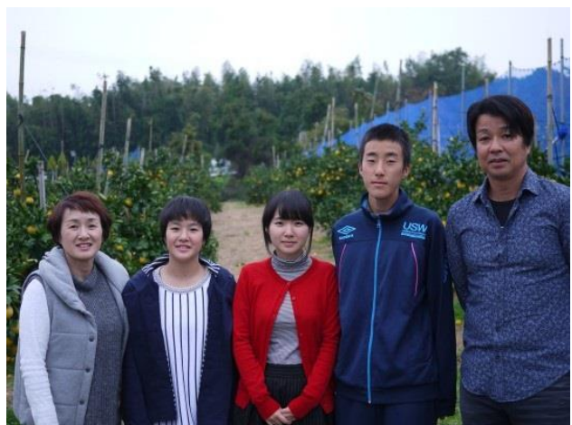
ホームページに毎年更新する家族写真