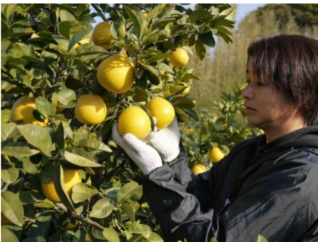
河内晩柑の収穫期判断