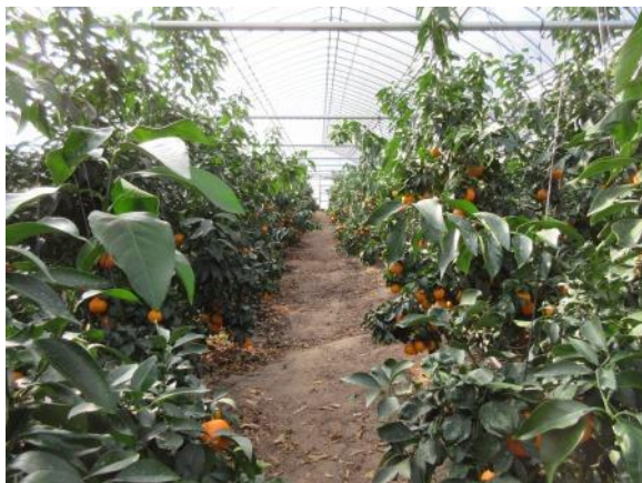
紅まどんなのハウス