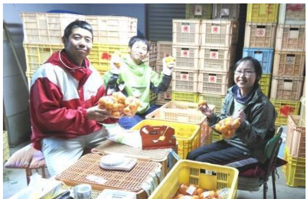
家族で柑橘の袋詰め