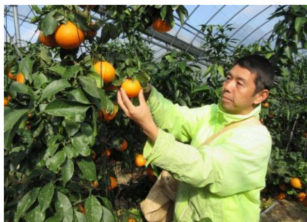
紅まどんなの収穫