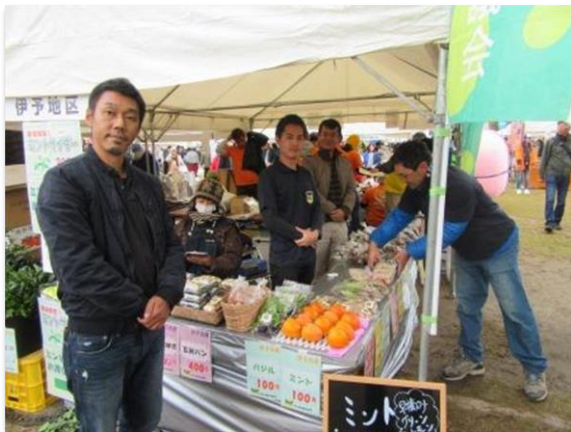
青年農業者仲間と諸行事参加