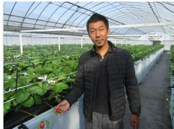
収穫間近となったいちご