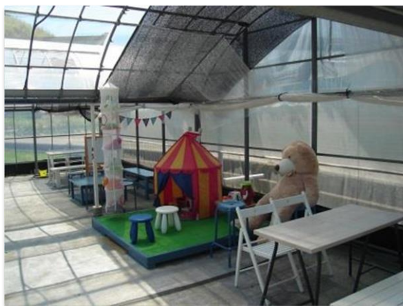
小さなお子さんが来ても対応できます

観光いちご園では多くの方が出入りしますので、薬剤散布は極力少なくすることを心がけており、平成29年には「エコえひめ」の認証を取得しています。また、通路も車いすが通れるくらい広く、高齢者や障がい者の方への配慮したいちご園しています。