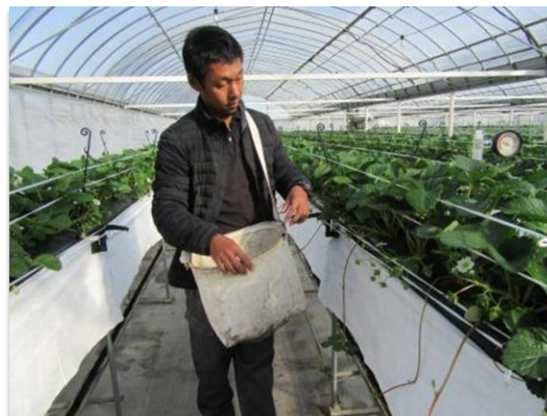
いちご管理状況、広い通路が目立ちます