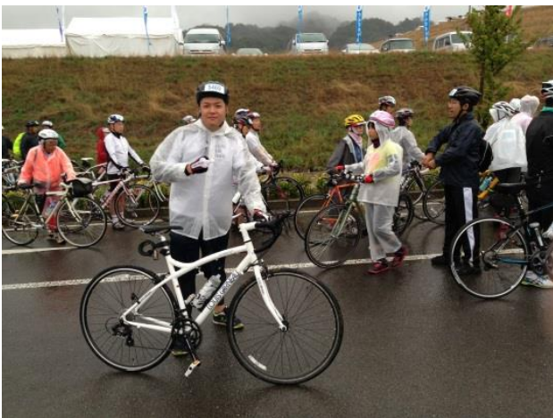
しまなみ街道のサイクリング大会に出場