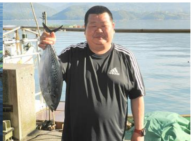
新たな愛育フィッシュ、「伊予の媛貴海」