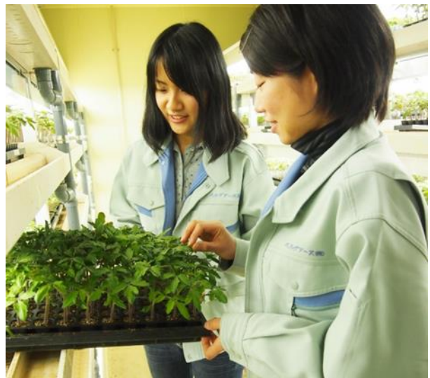
閉鎖型苗生産システム