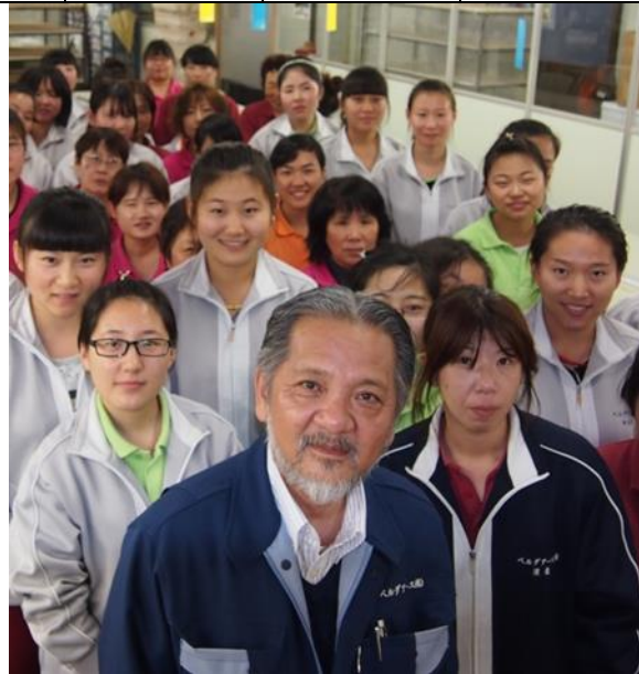
職場の仲間たちと