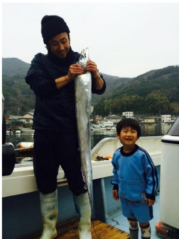
息子に釣果を自慢