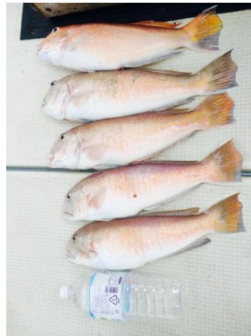
稀に3万円/kgの高級魚も