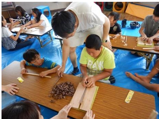
子供たちとお箸づくり