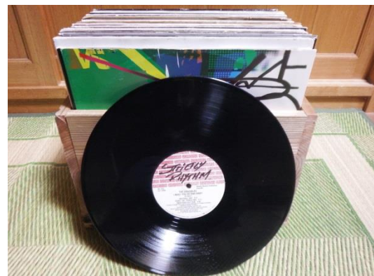
お気に入りのレコード