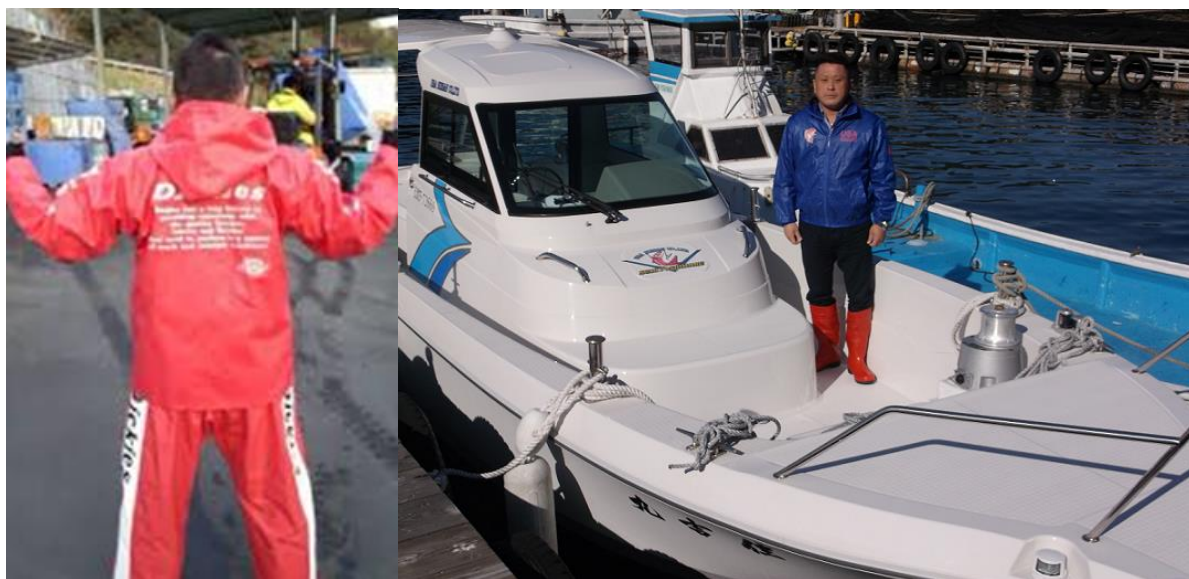
作業ガッパ、新調だゾ！ このドライブ船でバヤ-（お客さん）を沖の漁場視察にご案内…