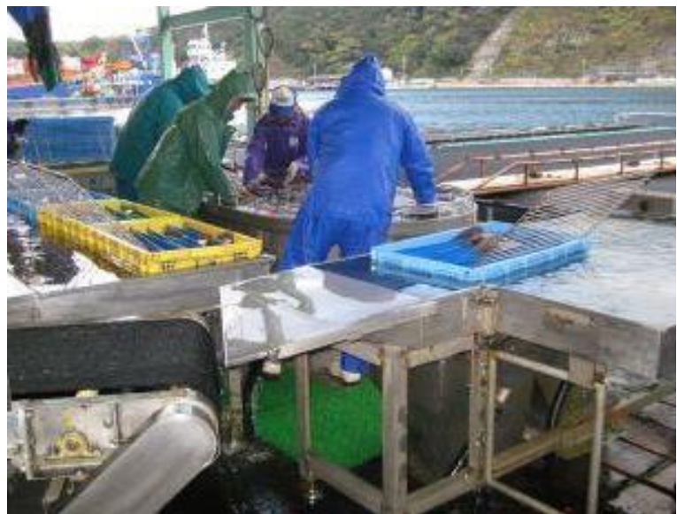
毎朝現場での出荷の選別作業！