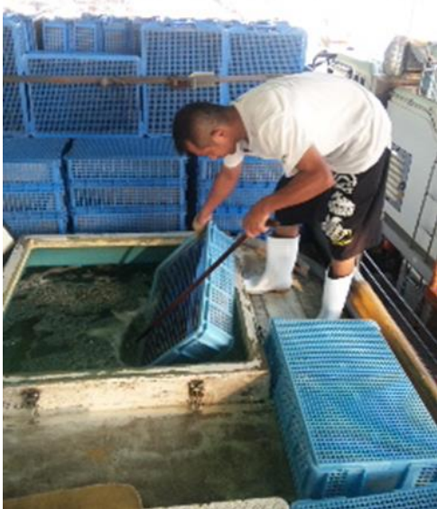
活魚トラックへの積み込み

「 顔の見える生産者（FACE TO FACE）、安全・安心な品質にこだわり、いいものをお客様に届ける 」が私たちの合言葉です。