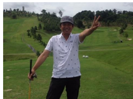
楽しい趣味の時間