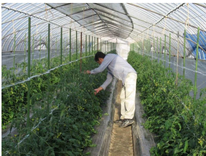
ハウス内での作業

また、作ったものを売るのではなく、売れるものを作ることを考えて、栽培に取り組むようにしています。