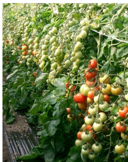
色づき始めた中玉トマト