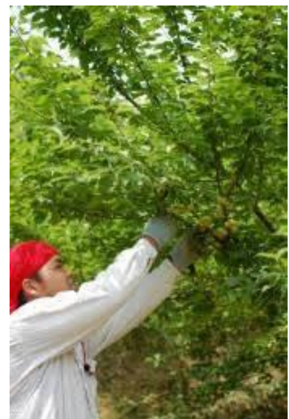
南高梅の収穫作業