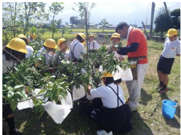
小学生と紅まどんなの袋かけ