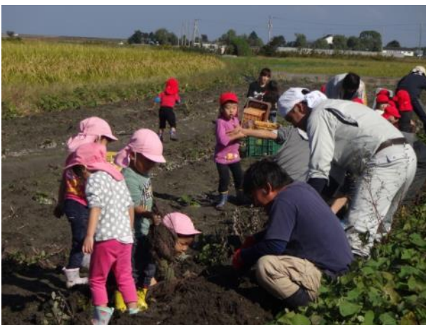
保育園児とサツマイモを収穫