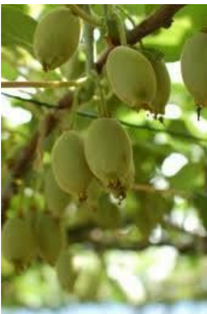
たわわに実るキウイ

また、梅は品質の良い「 南高 」を栽培し、産直市で販売しているほか、JA共販を行っています。梅干しの加工も行い高付加価値化にも取り組んでいます。