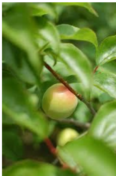
収穫間際の南高梅