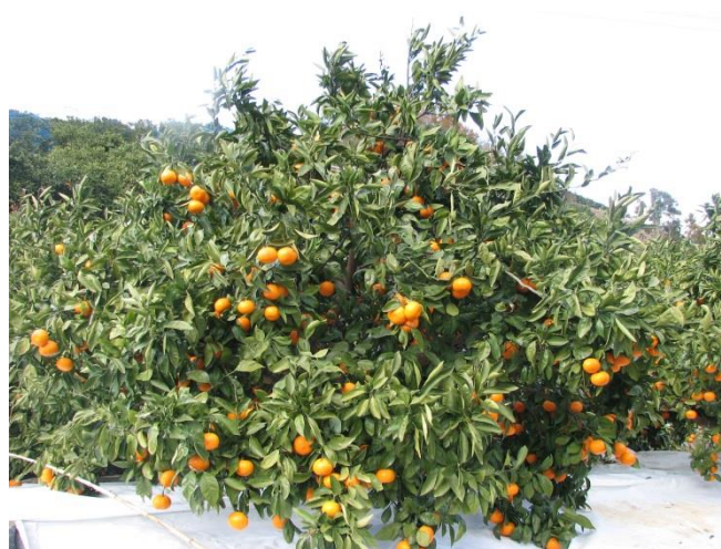
高品質安定生産に向けて努力しています