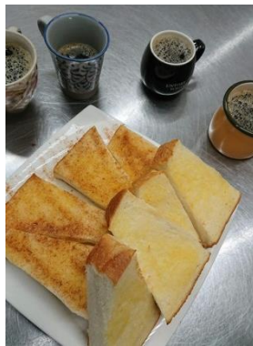
カフェの仕事の合間に従業員と一服