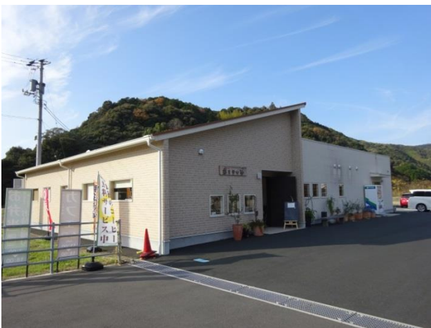
津島町にオープンした「あこやひめ」新店舗

当初、ボランティア的に各種イベントに積極的に参加し、対面販売でいい感触を掴んだことから、どうにかしてこの活動を楽しみに変えていこうと、 皆で知恵を絞り、夢を持ち寄り ました。「年金の足しに」程度の考えからスタートしましたが、今では、 家計を支える母ちゃんも出るなど、次世代にも希望を与えられる までになりました。平成27年、株式会社化、私たちはまだまだ前進し続けます。