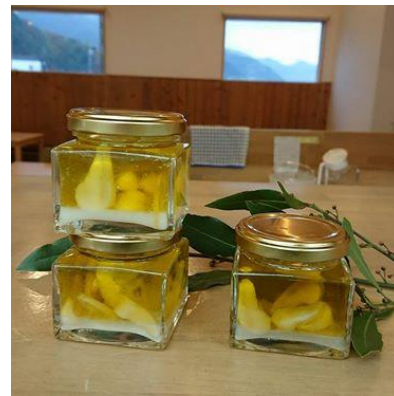
新商品の開発（真珠貝のオイルコンフィ）