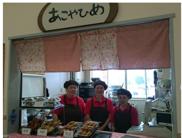
道の駅きさいや広場内の店舗