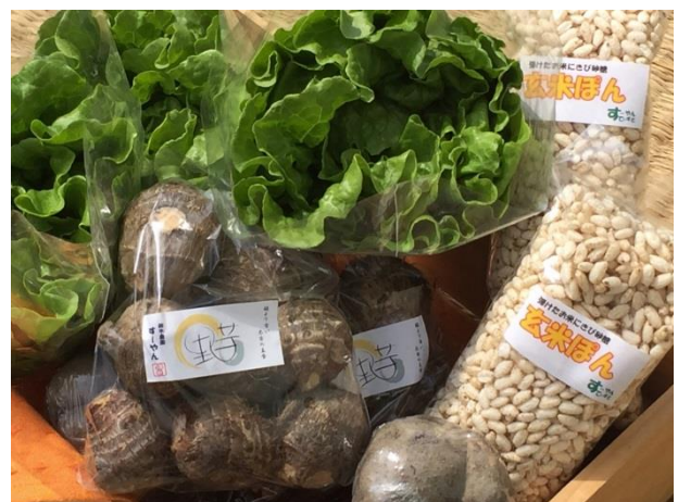
生産した野菜と加工菓子