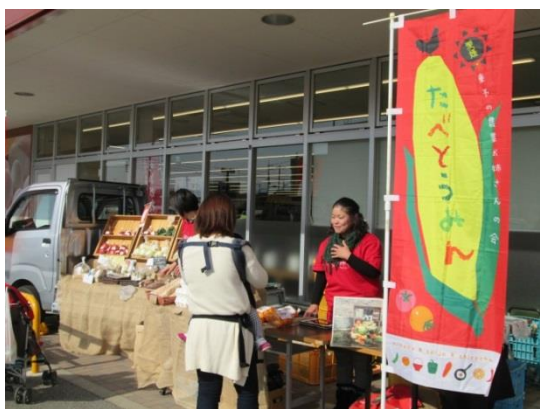
「たべとうみん」のマルシェ